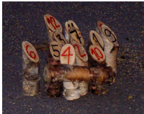
Et une version fait-main en action.

Aujourd'hui, le Mölkky est joué dans le monde entier. Les associations de Mölkky existent non seulement en Finlande, mais aussi dans de nombreux autres pays comme la Slovaquie, la France et le Japon. Il existe un Championnat du Monde de Mölkky (avec environ 200 équipes participantes) et même un Championnat en Australie !