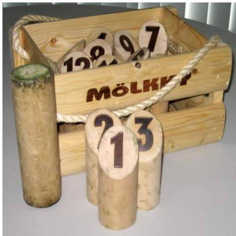
Un jeu de Mölkky original et populaire...

Alors que certaines entreprises vendent leur propre version de marque du jeu (comme Finska ou Klop), la marque Mölkky appartient à Tuoterengas. Tactic Games à l'autorisation de commercialiser à l'international.